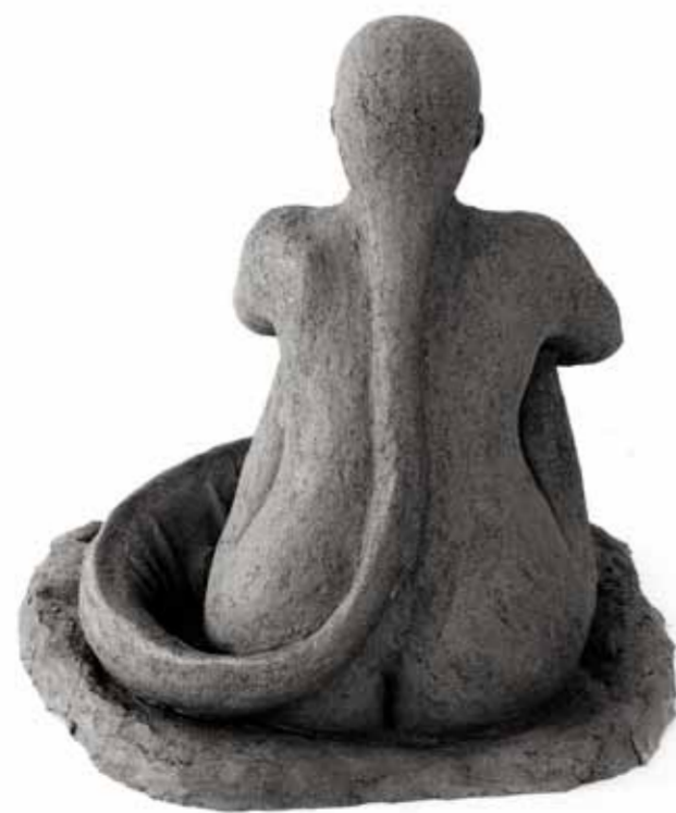
Du och jag, Ödlan, brons, 20x22x22 cm

Kullasalongen, Höganäs, 2010 Teckningstriennalen, Landskrona Konsthall 1994 Höstutställning, Malmö Konsthall 1986-87