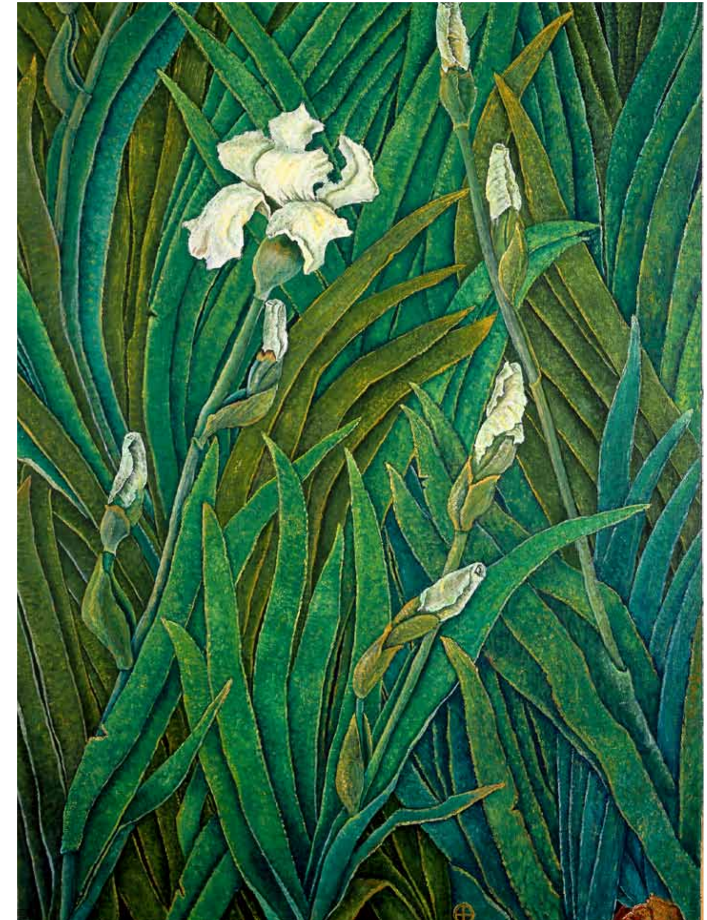
Innocentia, olja på duk, 132x135cm