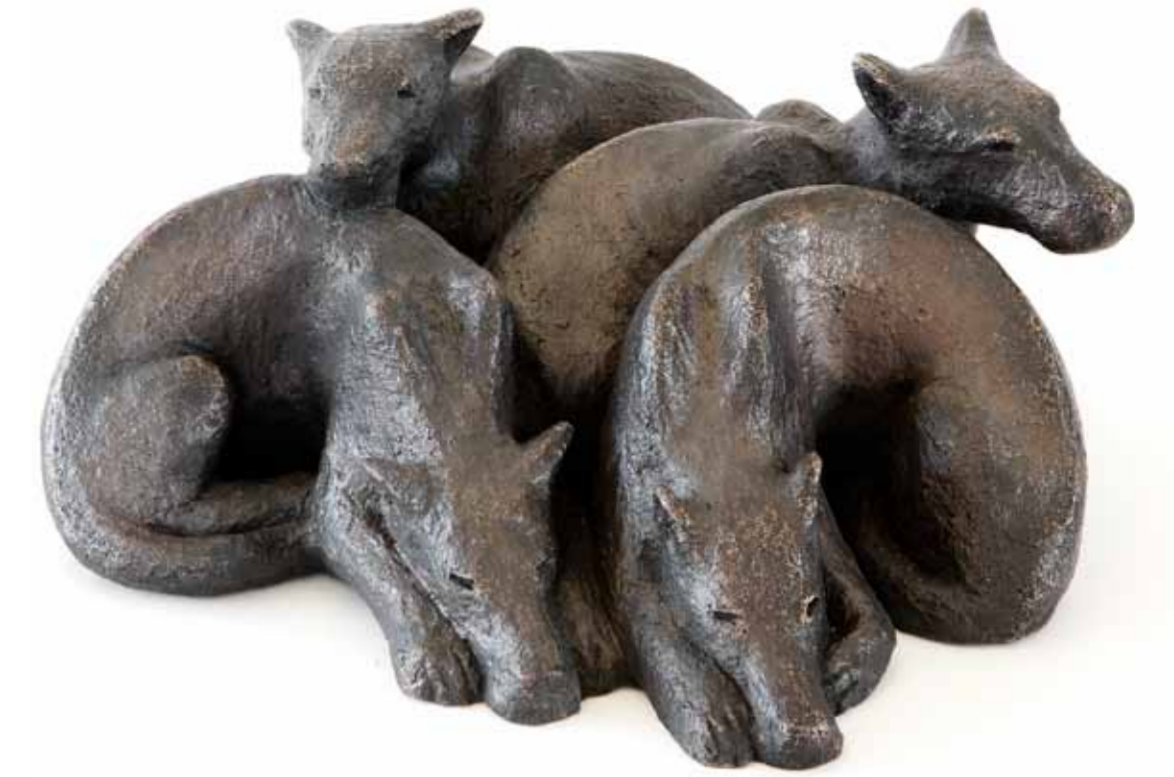
Vildhundar, brons, 10x22x22 cm

Bara de riktiga orden, orden med krona och fågel- sång har en skugga som träden.