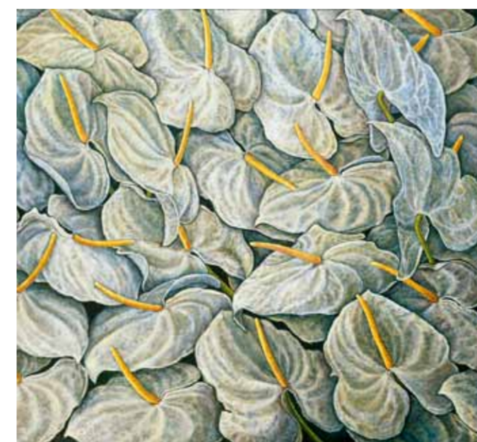
Invasion, olja på duk, 129x135cm